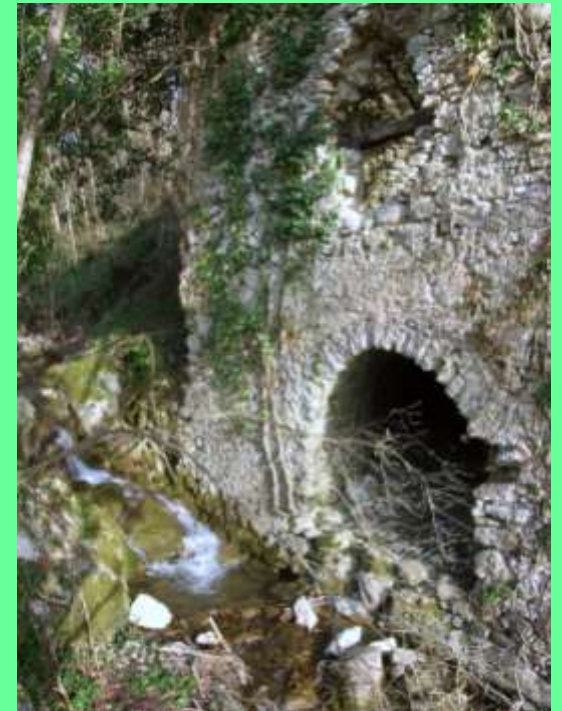
facciata del mulino