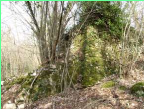
angolo ovest della “refota”