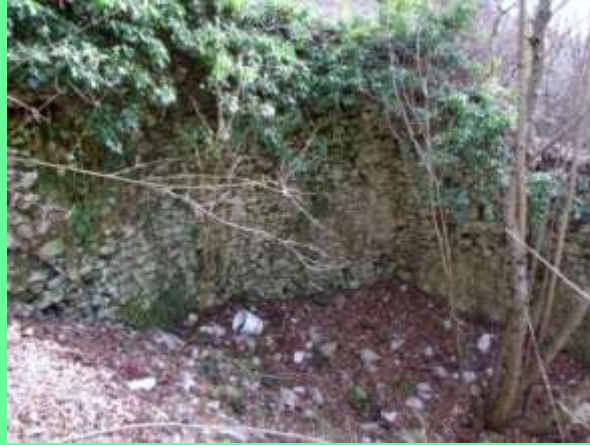
interno del mulino