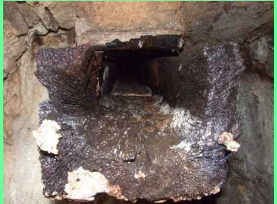
canale in legno che portava l'acqua al “ritrecene”