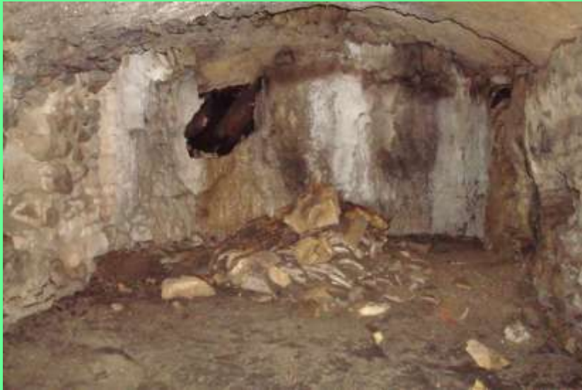
parete di fondo del “carcerario”