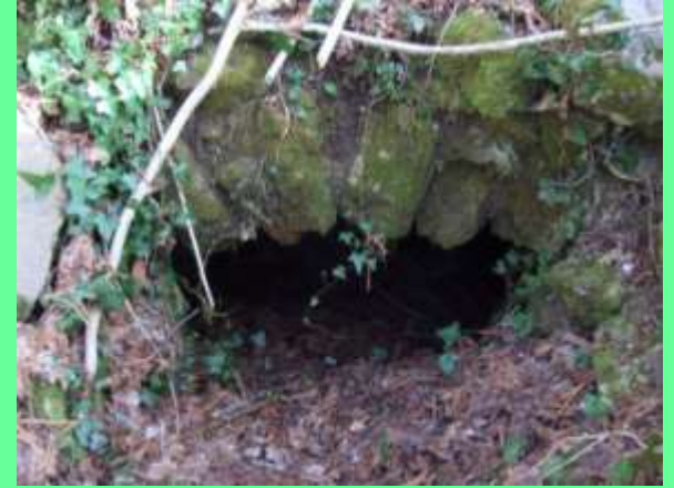
ingresso al “carcerario”