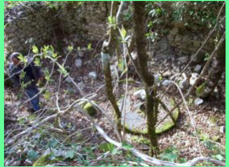
interno del mulino