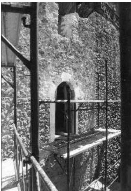
Pereto, restauri alle mura

Nel corso dei lavori, mediante la datazione di strutture e materiali, è stato possibile distinguere alcune importanti fasi di vita di Pereto e del suo territorio,