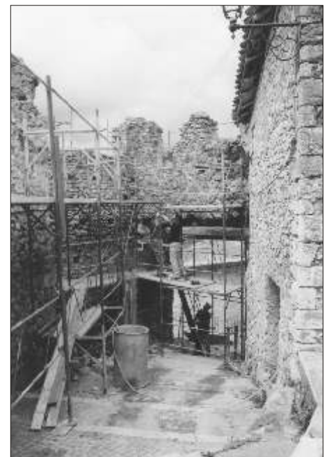
Pereto, porta delle Piagge durante i restauri