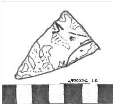
Pereto, materiali ceramici databili al XIII secolo

dioevo (ma anche da epoca protostorica e romana) all'epoca moderna: di consistente interesse i risultati dell'indagine affidabili ai periodi compresi tra Altomedioevo, la dominazione dei conti dei Marsi, dei Normanni, di Federico II e degli Angioini, sino ai dominati Orsini e Colonna, per un ampio arco cronologico fino al XVII secolo.