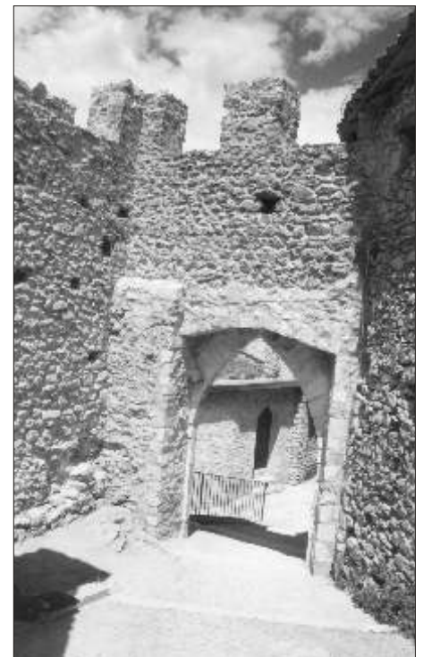
Pereto, porta delle Piagge, dopo i restauri (sopra e sotto)