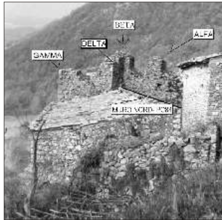
Pereto, porta delle Piagge, veduta della merlatura prima dei restauri

una significativa e preziosa attestazione archeologico-architettonica del tessuto urbanistico del paese e della sua antica storia. Gli interventi ricostruttivi realizzati in accordo con il Servizio Tecnico del Territorio dell'Aquila-Sezione di Avezzano (ex Genio Civile) e con la Soprintendenza ai Beni Ambientali e del Paesaggio, ha incluso nel cantiere la partecipazione di personale tecnico qualificato, in fattispecie un'archeologa proposta dall' Associazione Culturale Lumen (5). La collaborazione archeologica in cantieri di questo tipo è sempre auspicabile in quanto possono essere fatte salve informazioni specifiche sulla muratura, che diversamente soprattutto in assenza di impalcature in grado di accedere a zone altrimenti irraggiungibili o successivamente a restauri che obliterano originali caratteristiche murarie andrebbero irrimediabilmente perdute. È stato dunque possibile documentare le diverse strutture murarie in fase antecedente al restauro e se ne sono ricavate informazioni utili alla ricostruzione cronologica del sito e, durante il