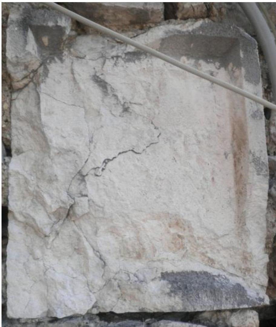
Figura 1 - Riquadro di Porta di castello

Il manufatto è un unico blocco di pietra. 1 La cornice oggi è rotta in più punti e la pietra è lesionata. L'interno è scarpellato, probabilmente qualcuno ha rimosso qualcosa che era stato apposto nel riquadro oppure ha scarpellato un fregio presente all'interno del riquadro; in merito a queste possibili azioni non è stato trovato un riscontro scritto.