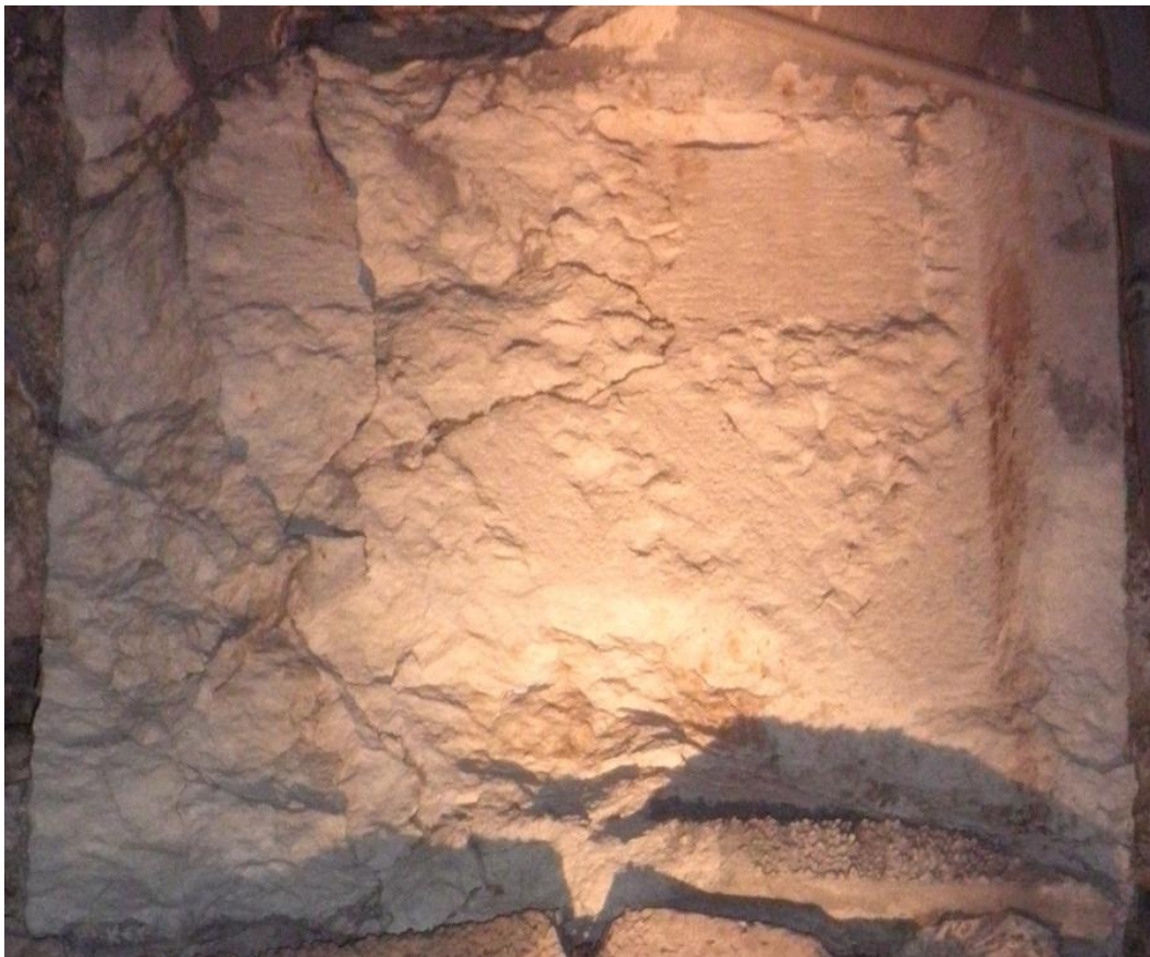
Figura 4 - Riquadro di Porta di castello di notte

A fronte delle analisi e delle conclusioni fatte per il riquadro della Corte di giustizia , ho provato ad analizzare la lapide di Porta di castello utilizzando una luce messa ortogonale alla lapide. Sono state scattate alcune foto in notturna; in Figura 4 è riportata una di queste immagini.