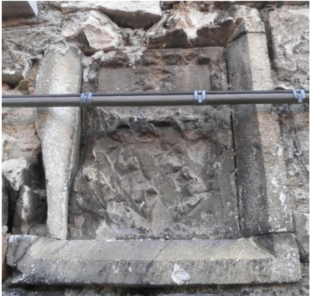
Figura 2 - Riquadro dei due archi

A metà del paese, in prossimità della chiesa di San Giorgio martire si trova la costruzione composta di due archi in pietra. Questo edificio sarebbe la Corte di giustizia , localizzata in via di San Giorgio, 59 e 61. In alto tra i due archi si trova murato un riquadro in pietra riportato nella Figura 2.